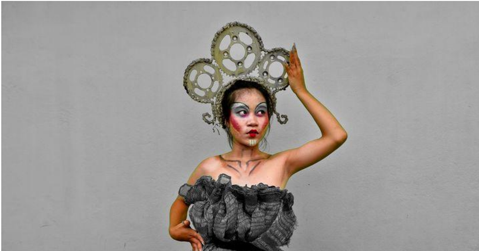
Recycling-Kunstprojekt, FICAC, Kambodscha