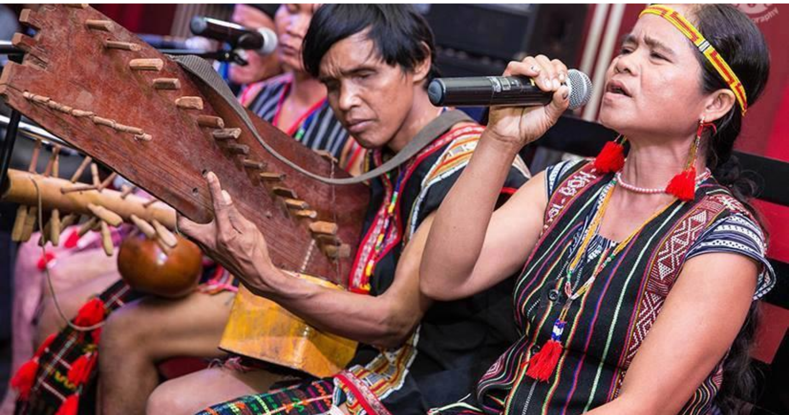
Musikfestival mit Indigenen Musikern, FICAC, Kambodscha

Liebe Unterstützerinnen und Unterstützer